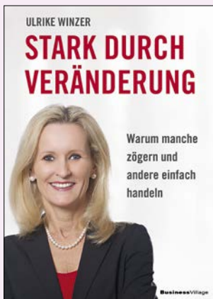
Ulrike Winzer: Stark durch Veränderung . Business Village, 2021, 24,95 Euro